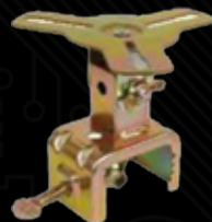
回転灯クランプ 可動式