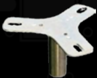
鉄皿 (ブーメラン型)