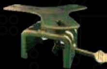
回転灯クランプ 固定式